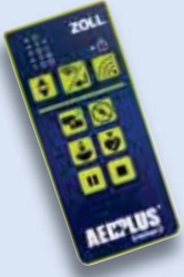
Ersatz AED Plus Trainer2-Fernbedienung