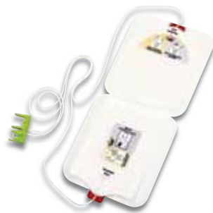
Stat-padz® II-Trainingselektroden (VE: 6)