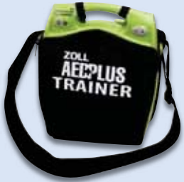
AED Plus Trainer-Tragetasche