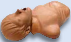
AED Plus Trainer-Demo-Übungspuppe