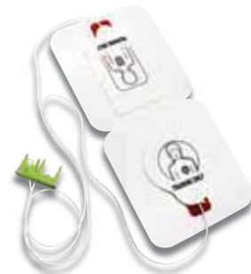
Pedi-padz® II-Trainingselektroden (VE: 6)