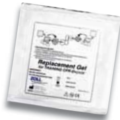
Ersatz-Klebegels für CPR-D-padz-Trainingselektroden

(Ersatzteile müssen separat bestellt werden)